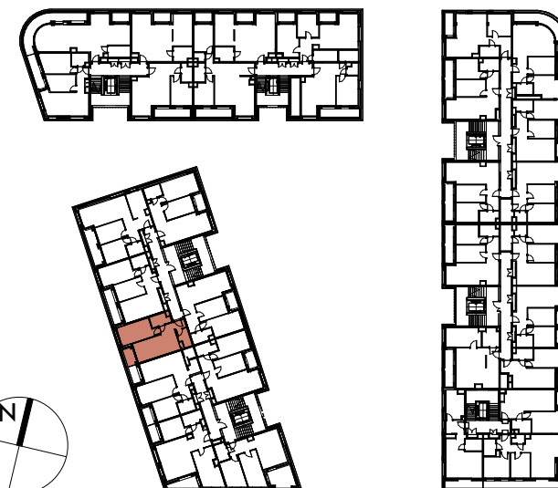
BUDYNEK B1.3 | RZUT PIĘTRA 05